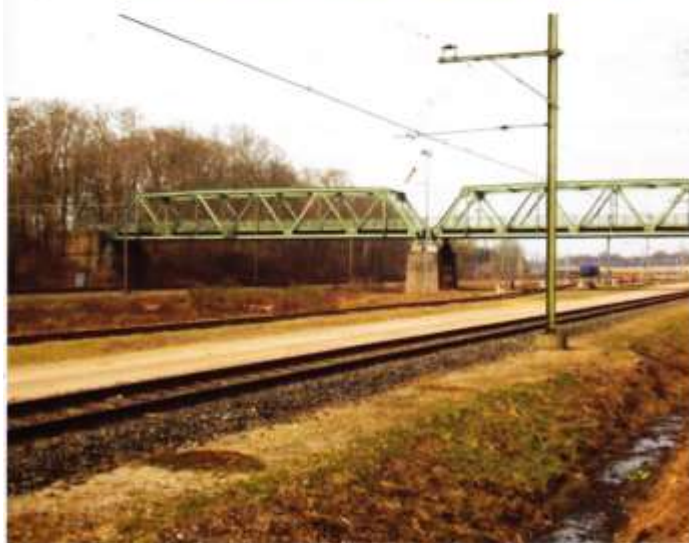
De spoorbrug die op een gemetselde pijler staat is al van veraf te zien. Tegenwoordig razen hier de intercity's onderdoor